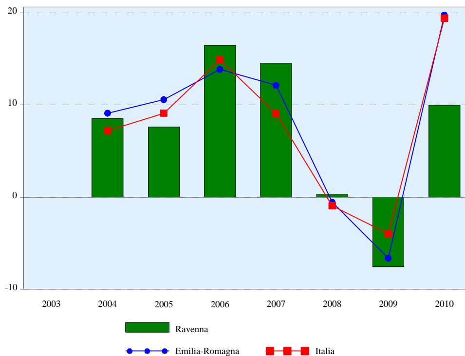
Graf. 1 - Esportazioni, andamento tendenziale