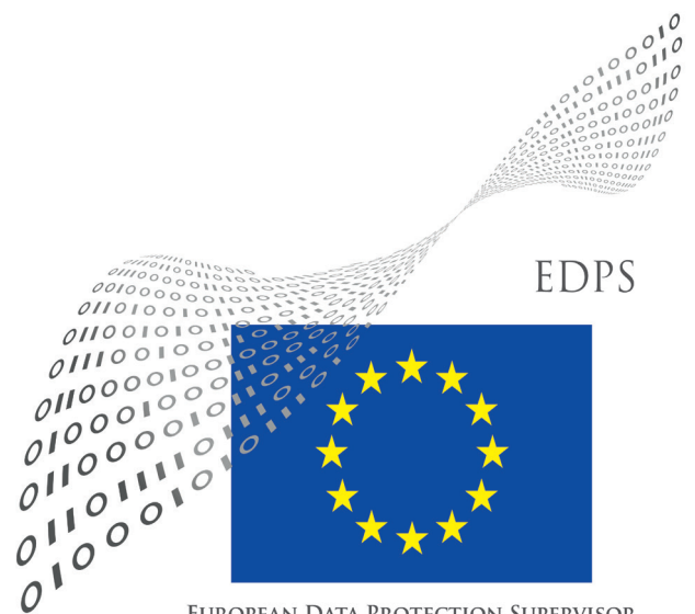
EUROPEAN DATA PROTECTION SUPERVISOR

Il nuovo Regolamento rappresenterà un volano per lo sviluppo dei servizi che si basano sul Big Data: la creazione di norme da applicare in materia uniforme nei 28 Stati Membri favorirà un'innovazione più 'sostenibile' e privacy-friendly, anche attraverso il rafforzamento della certezza giuridica; i rinforzati obblighi di trasparenza nel trattamento dei dati accresceranno la fiducia dell'utente nei mercati digitali; i principi di 'protezione dei dati fin dalla progettazione' e della 'protezione per impostazione predefinita' consentiranno di incorporare la privacy come elemento intrinsecamente presente nei nuovi servizi digitali. Ciò innescherà un positivo 'circolo vizioso' tra rispetto della privacy, innovazione e crescita economica.