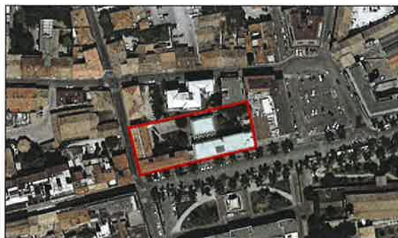
Veduta dalla Sede Centrale della CCIAA di Ravenna.