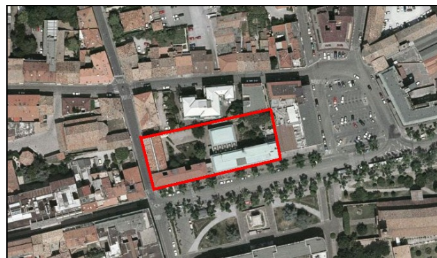
Veduta dalla Sede Centrale della CCIAA di Ravenna.