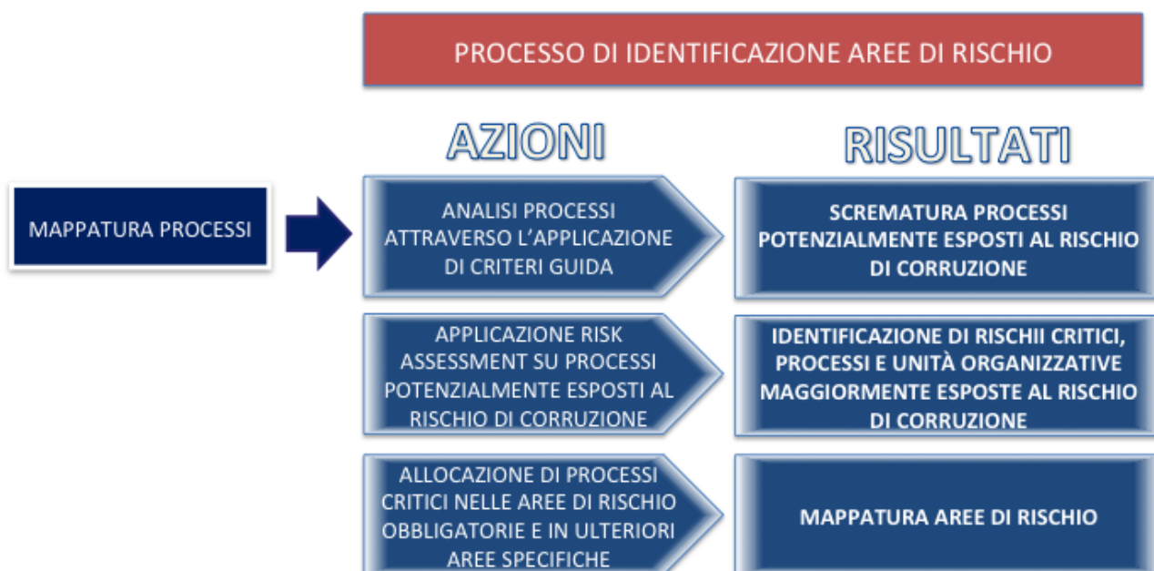
Figura 3: Iter metodologico per l'identificazione delle aree di rischio